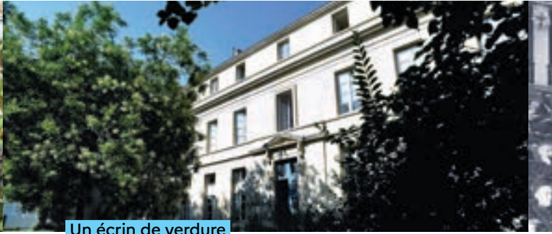
Un écrin de verdure

Surnommé autrefois « jardin du général », gouverneur de l'École polytechnique, le jardin du Pavillon Boncourt est accessible par une entrée faisant face à l'amphithéâtre Arago, mitoyen du Collège de France et du ministère.