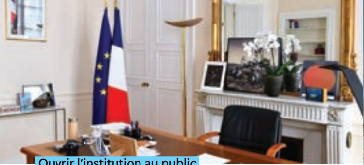
Ouvrir l'institution au public

À l'occasion des Journées européennes du Patrimoine, le ministère de l'Enseignement supérieur et de la Recherche ouvre au public les portes du bureau ministre situé au cœur du Pavillon Boncourt, hôtel particulier du XVIII e siècle.