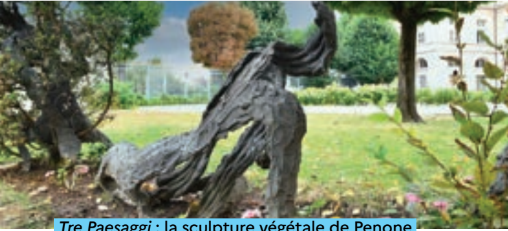
Tre Paesaggi : la sculpture végétale de Penone

À droite de la Cour d'honneur, une sculpture alliant bronze et végétaux a été réalisée par l'artiste italien Giuseppe Penone. Elle est composée de trois personnages, l'un assis, l'autre allongé et le troisième debout, enserrant chacun dans leurs bras un arbre. L'artiste, qui appréhende la nature comme matériau premier de la sculpture, a voulu illustrer la relation profonde entre l'homme et la nature en les fusionnant.