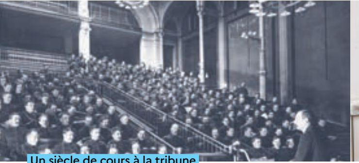
Un siècle de cours à la tribune

Afin de fournir des locaux plus adaptés à l'enseignement de la physique, l'École polytechnique fait construire un amphithéâtre, de 1879 à 1883.