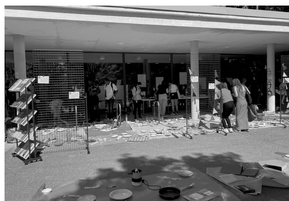
Figure 1. Troc Party 2023 à la BU Proudhon

Son action culturelle s'est peu à peu diversifiée, avec davantage d'ateliers, de débats, de rencontres et d'événements, ainsi que des expositions . Les bilans chiffrés atteignent environ 80 actions réalisées par année civile – et à titre d'exemple, l'habituelle Troc Party de rentrée (citée en #45 dans le hors-série d'avril 2020 de l'Association des bibliothécaires de France [ABF] « + de 100 idées pour changer ta bib ») représente plus de 10 000 objets récoltés, stockés, diffusés.