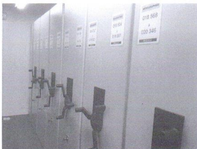
Un magasin à stockage dense